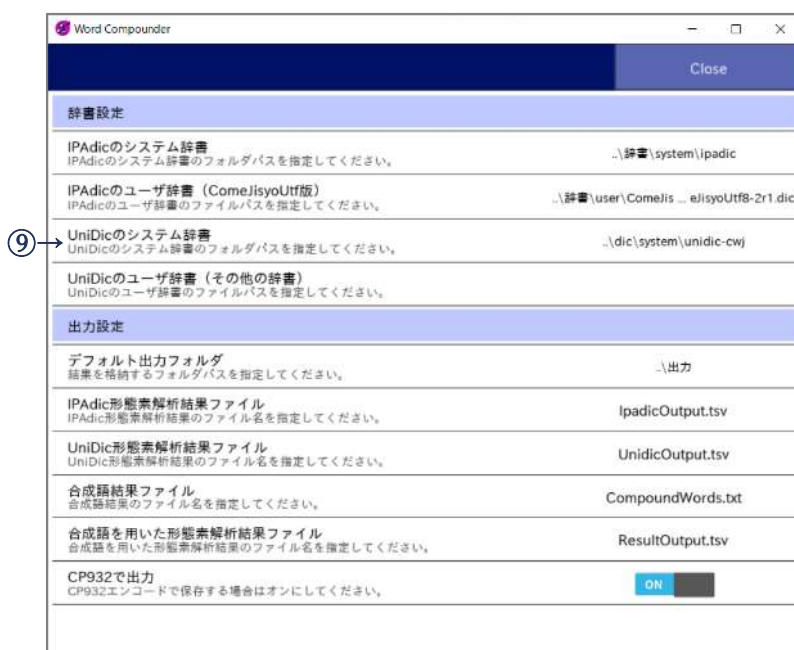
図 11 UniDic の設定画面