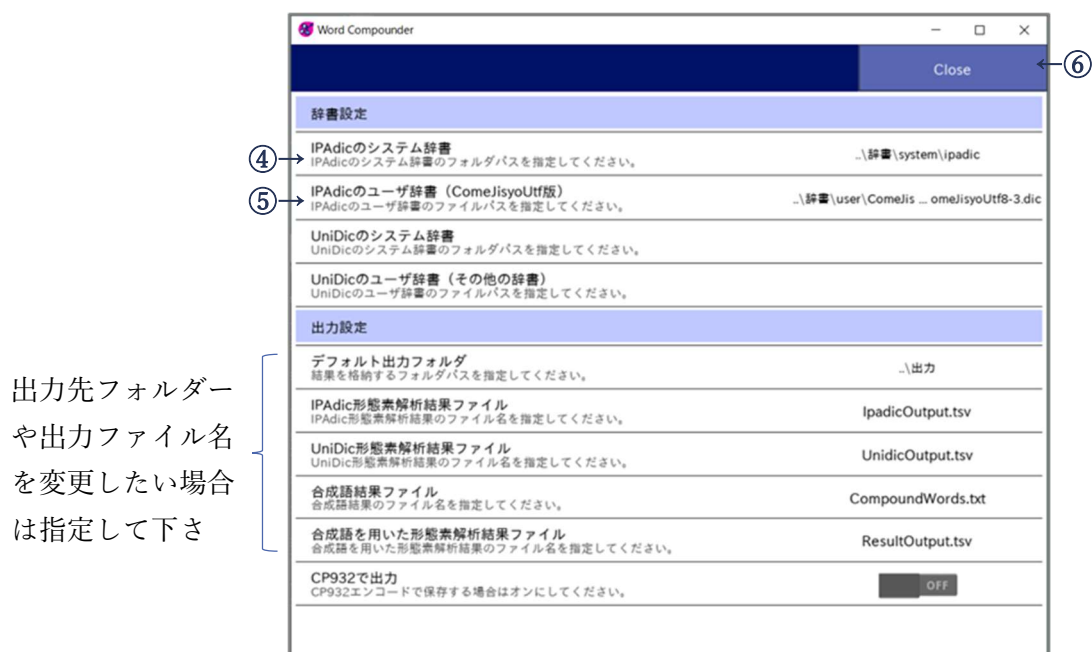
図 7 辞書および出力先設定画面