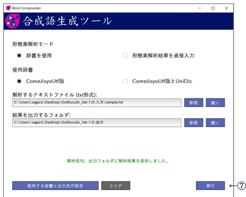
図 8 解析成功のメッセージ（5 秒間表示）

(6) 解析に成功しますと、指定した出力フォルダーにテキスト形式の生成した合成語候補のファイルと、tab 区切りの IPA 辞書 & ComeJisyo による解析結果、そして生成した合成語による分かち書き結果の 3 種類のファイルが出力されます。 生成された合成語が反映された分かち書きデータでは、生成された合成語の品詞は「名詞,一般,合成語」となっています。