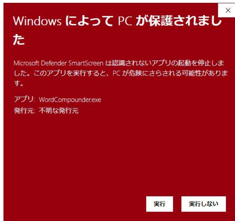
図 13 Windows アラート画面

本ツールはオープンソースの未署名プログラムです。そのため、Windows の仕様により、初回起動時に図 13 の画像のようなアラートが表示されます。