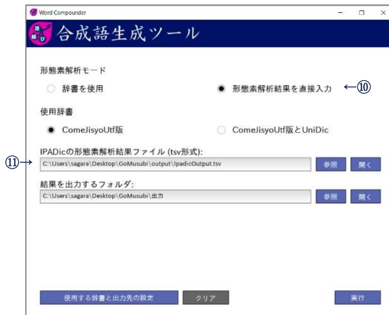
図 12 形態素解析結果からの合成語生成

MeCab の形態素解析の精度は、使用する辞書の品詞誤りなどにより、100%ではありません。ComeJisyo の見出し語には、記号を含む合成語が含まれ、これらは過分割されます。また見出し語の通りに分かち書きされたとしても、利用者が期待する語単位ではない場合も少なくありません。そこで「語結び」では、形態素解析結果の見出し語や品詞などをエディタなどで加筆・修正したファイルを入力として合成語を生成します。利用者は、図5のメイン画面で「形態素解析結果を直接入力」のチェックボタンをオンにし、加筆・修正済みの形態素解析データを設定し、「結果を出力するフォルダー」を指定し、実行ボタンを押すことで、新たに合成語を生成し、これらが反映された分かち書きデータを得ることができます。