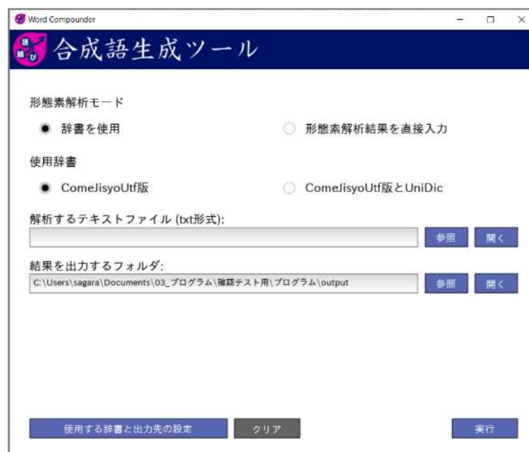
図 5. メイン画面