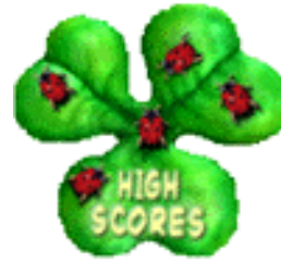
Die Highscore-Liste anschauen