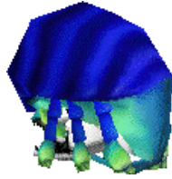
Rollie McFly in Ball Form.

Solange Rollie in Käfer Form ist, kann er springen und Fußtritte verteilen. In Ball Form rollt er daher, und kann so Feinde oder andere Objekte aus seinem Weg schaffen. In Ball Form ist er auch besser gegen Feinde oder andere Gefahren geschützt.