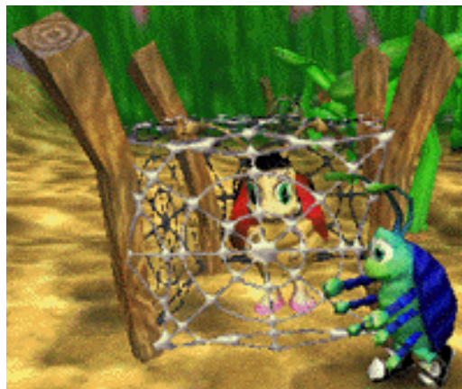
Eine eingesperrte Lady Bug

Die Punktzahl wird durch die Anzahl befreiter Lady Bugs und die Anzahl gesammelter Kleeblätter bestimmt. Alle Lady Bugs sind in Spinnennetzen gefangen. Rollie kann sie mit einem Fußtritt aus ihrem Gefängnis befreien (siehe Steuerung). Die befreiten Lady Bugs fliegen auf und davon.