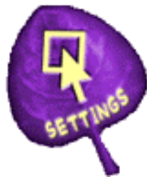
Spieleinstellungen und Spielsteuerung