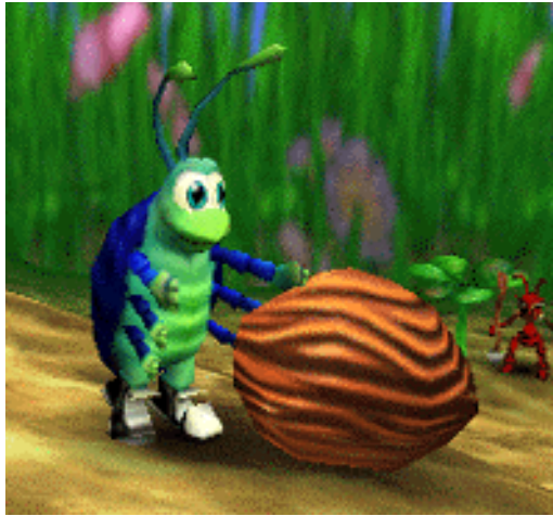
Rollie öffnet gerade eine Nuss

sich in einer Nuss befindet. Nüsse können entweder mit einem Fußtritt, oder durch Hineinrollen geöffnet werden.