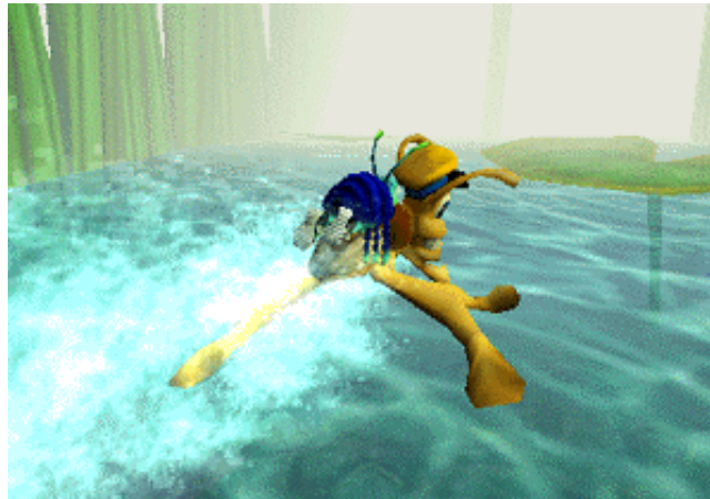
So kommt man am besten über den Teich!

Das Wassertaxi kann nur nach links oder rechts gesteuert werden. Sie haben keine Kontrolle über die Geschwindigkeit. Benutzen Sie den Springknopf, um vom Wassertaxi runterzusteigen.