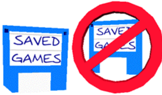
Das „Spiel speichern“ und das „Spiel nicht speichern“ Zeichen

Wenn Sie sich dazu entschlossen haben, das Spiel abzuspeichern, werden Sie in der üblichen Macintosh-Art aufgefordert, einen Namen für die Datei zu wählen. Um ein gespeichertes Spiel wieder zu laden, klicken Sie auf das „Spiel Laden“ Zeichen in der Hauptauswahl.