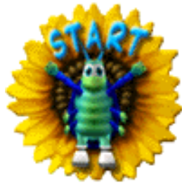
Ein neues Spiel beginnen