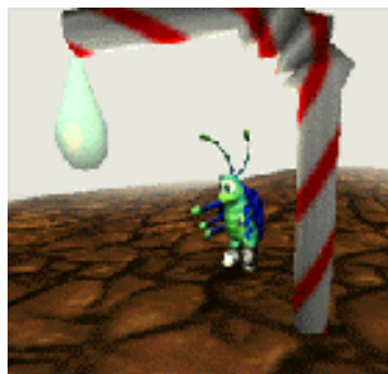
Rollie muss den Tropfen des Kontrollpunktes berühren.

Kontrollpunkte sind Punkte, zu denen Rollie falls er stirbt zurückkehrt. Normalerweise muss Rollie im Todesfall an den Anfang der Spielstufe zurückkehren. Hat er jedoch zuvor einen Kontrollpunkt berührt, kann er von diesem Punkt aus wieder anfangen.