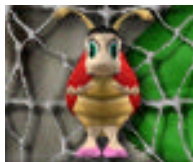
Es gibt immer noch gefangene Lady Bugs auf dieser Spielstufe.

Als nächstes folgt eine Lady Bug Figur, die anzeigt, ob alle Lady Bugs auf dieser Spielstufe befreit worden sind. Die Anzeige liest sich wie folgt: